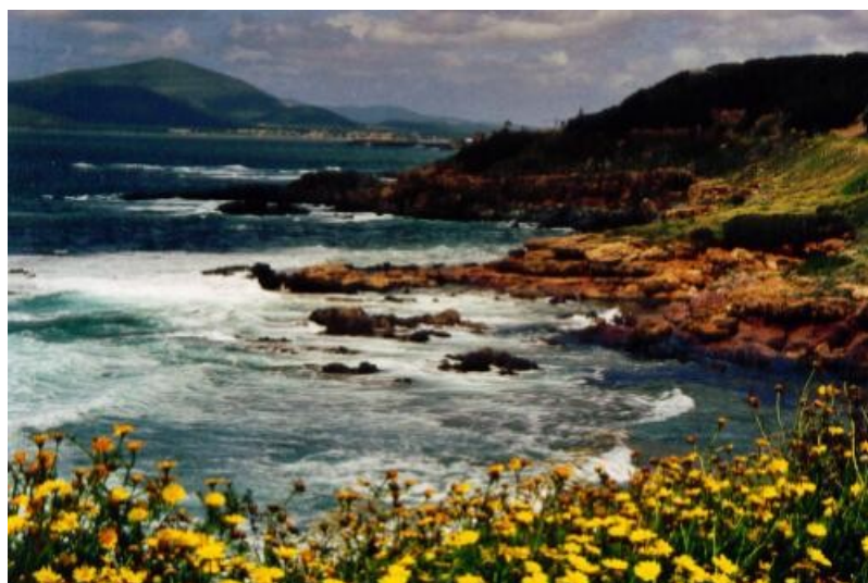
Panoramastrecke zwischen Bosa und Alghero